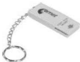
LP004 - štart / stop magnet