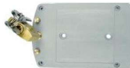
F9000 - držiak na stenu