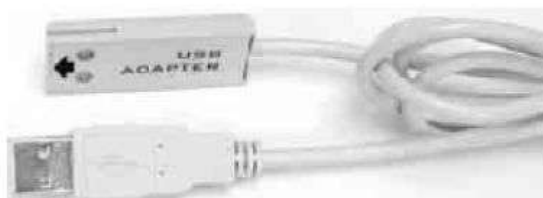
LP003 - adaptér pre komunikáciu cez USB