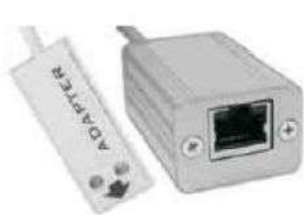
LAN adaptér LP005