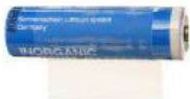
A4203 - náhradná lithiová batéria 3,6V, rozmer AA, bez vývodov