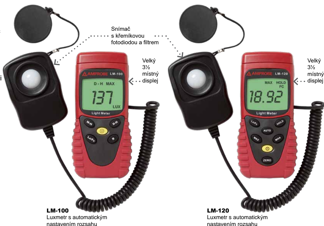
LM-100 Luxmetr s automatickým nastavením rozsahu