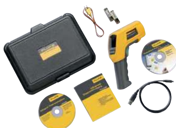
Fluke 568 a standardně dodávané příslušenství