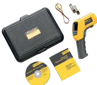
Fluke 566 a standardně dodávané příslušenství