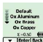
Výběr povrchu měření