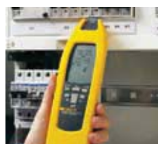
Vyhledávání pojistek/jističů a osazení obvodů